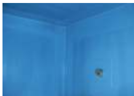
■ Az első szigetelőréteg felvittele

Az előkészített aljzatra hengerrel vagy ecsettel kell felhordani az első réteg Prince Color® IZOL K-t.