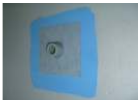
■ Csőtörések, padlóössze folyók szigetelése

A síkból kiugró szerkezeti elemek, lefolyók, szennyvízelvezetők és egyéb vezetékek szigetelése a Prince Color® IZOL M szigetelő mandszettának a még nedves Prince Color® IZOL K szigetelőanyagba történő beillesztésével történik.