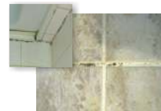
■ MIÉRT használjunk vízszigetelést?