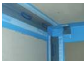
■ Sarok szigetelése

Az alapozóréteg megszáradását követően végezzük el a sarokok, a dilatációs fugák és a különböző szerkezeti elemek szigetelését! A Prince Color® hajláterősítő szalagot helyezzük rá a Prince Color® IZOL K szigetelőanyag nedves felületére, és nyomjuk bele az anyagba!