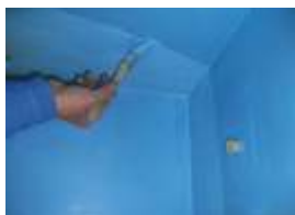
■ A második szigetelőréteg felhordása

Az első réteg megszáradását követően (kb. 1 óra) kell felhordani a második réteget, amelynek teljes mértékben be kell fednie az első réteget, beleértve a szigetelő szalagokat, és mandszettákat is. A második réteg megszáradását követően megkezdhetjük a csempek és járólapok fektetését. A két réteg vastagsága összesen 1 mm.