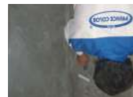
■ Alapozás A munkafolyamat

A kiegyenlített, száraz és tiszta aljzatra hordjuk fel a Prince Color® PGM mélyalapozót! Az alapozást hagyjuk megfőlni megszáradni!